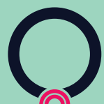
Dor de garganta