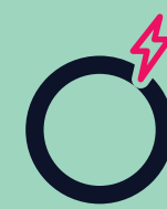
Dor de cabeça