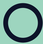
Dor no peito